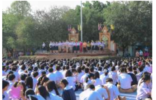
ภาพกิจกรรมการมอบรางวัลหน้าเสาธง