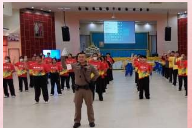
กิจกรรมพัฒนานักเรียนที่มีศักยภาพเฉพาะด้าน